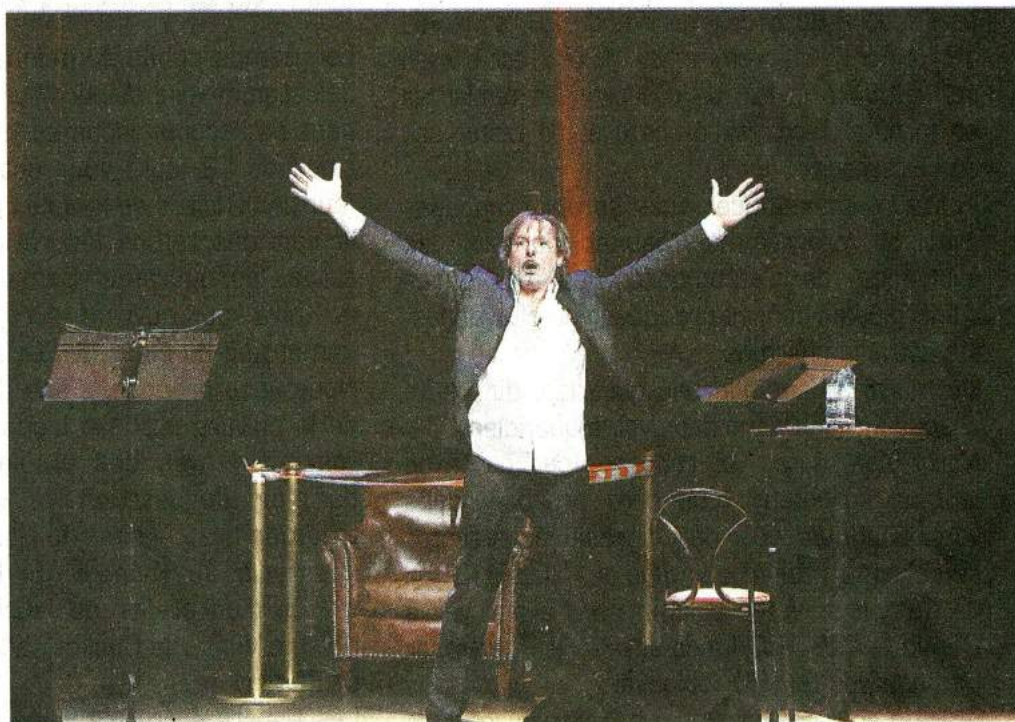
Humour garanti avec Christophe Alévêque vendredi à La Prade.

C'est dans cette même veine qu'aujourd'hui il reprend ses célèbres « Revues de presse », qu'il adapte chaque soir ; une thérapie de groupe improvisée, sans limites, sans structure et sans tabous. S'il s'acharne en-