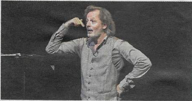
Christophe Alévêque sur scène à Pradines le 7 février 2020.